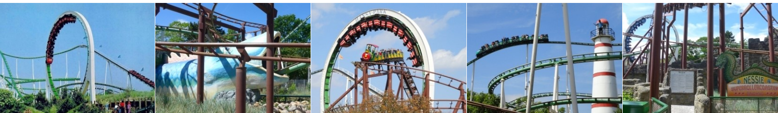
Zeitstrahl von links nach rechts: Postkartenansicht kurz nach der Eröffnung, Abfahrt ins Maul des Seeungeheuers, Rendezvous im Loop, immer um den Leuchtturm und der umgelegte Eingang.

Das Layout Nessies ist weltweit einzigartig. Trotzdem gab es von 1982 bis 2015 eine Schwesternanlage im argentinischen Parque de la Ciudad . Die Bahn fuhr unter dem Namen Aconcagua , hatte jedoch keinen Looping. Heute sind weltweit nur noch knapp 50 Schwarzkopf Coaster in Betrieb. Darunter der erste jemals gebaute Looping Racer. Er steht als Revolution im kalifornischen Six Flags Magic Mountain .