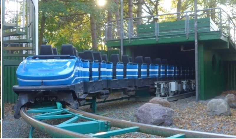
Nessie von oben im Jahr 2015 (links) und der blaue Zug auf dem Weg vom Bremsstunnel zum Bahnhof (rechts).

Wo sich heute der Highlander erhebt stand seit 1994 ein rot-weißer Leuchtturm. Im selben Jahr kamen erstmalig drei unterschiedlich farbige Züge zum Einsatz. Führen seit der Eröffnung drei rote Züge auf der Strecke konnte nun in roten, blauen und grünen Wagen Platz genommen werden. Mit dem Bezaubern des Britannien erhielten die Züge Farbkleider in Purpur und Dunkelgrün. Jeder Achterbahnzug bietet 28 Fahrgästen, aufgeteilt auf 14 Sitzreihen, Platz. Die Theoretische Kapazität ist mit 1.700 Personen/Stunde angegeben. Tatsächlich kann von 960 Personen/Stunde ausgegangen werden. Alleine schon da heutzutage maximal zwei Züge gleichzeitig zum Einsatz kommen. Trotzdem verbleibt eine nahezu doppelt so hohe Kapazität wie bei der Hauptattraktion Kärnan.